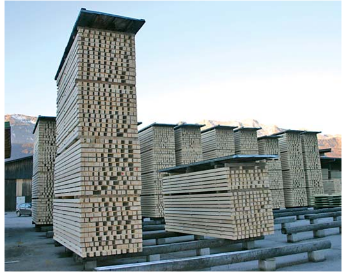
Knapp 90% des Schnittholzes wird exportiert – die Fakturierung erfolgt mit dem Holz-Manager

Die derzeit permanenten Preisschwankungen können mit dem Holz-Manager einfach verwaltet werden. „Seit Mai hatten wir monatlich mindestens eine Anhebung bei den Preisen“, meint Egger kopfschüttelnd. Das Rundholz wird fast ausschließlich im Inland eingekauft – in einem 150 km-Umkreis. Er könne sich bei den Preisen aber nur nach den großen Sägewerken richten. Egger beliefert – meist über Vertreter – Hobelwerke und Baumärkte in ganz Italien. „Momentan lassen sich unsere Kapazitäten verkaufen, wir bedienen eine Nische und sind in unserer Größe noch flexibel.“ Um am Markt Schritt halten zu können, denkt er aber über eine Erneuerung im Maschinenpark nach. MN